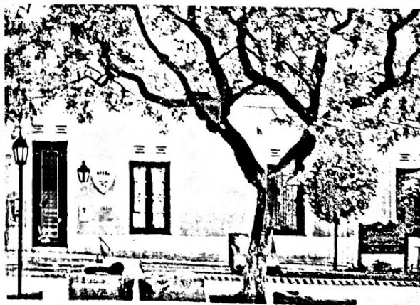
En el Museo Histórico Regional de San José, se expone la historia y el desarrollo de la colonia agrícola a través de la exposición de piezas, documentos y otras fuentes de información.

La colonia comenzó a delinearse el 2 de julio de 1857 y se inauguró un mes después. En ese lapso, se realizaron las tareas de mensura y distribución de los terrenos y la asignación de espacios comunes, como los de circulación. En tanto, se confeccionaron y firmaron los contratos de colonización con cada familia, así como el reglamento de convivencia que planteaba la prohibición de venta de bebidas alcohólicas y la imposición del trabajo personal en obras públicas. En los contratos individuales, se estipuló que a cada familia le correspondería una parcela de dieciséis cuerdas cuadradas (unas 24 hectáreas), cuatro bueyes, dos caballos, dos vacas, madera, leña y un adelanto de dinero. Estos adelantos de medios de vida y de trabajo le generaban a cada familia una deuda, que debía reembolsar a lo largo de cinco años cediendo un tercio del producto de su cosecha. Para garantizar el pago, en el contrato se incluía la prohibición de desarrollar ganadería comercial en el predio asignado. Una vez abonada la deuda, la parcela quedaba en propiedad del colono. La colonización agrícola, en sus distintas modalidades, se extendió por toda la provincia y, a fines del siglo, había cerca de doscientas colonias en Entre Ríos.