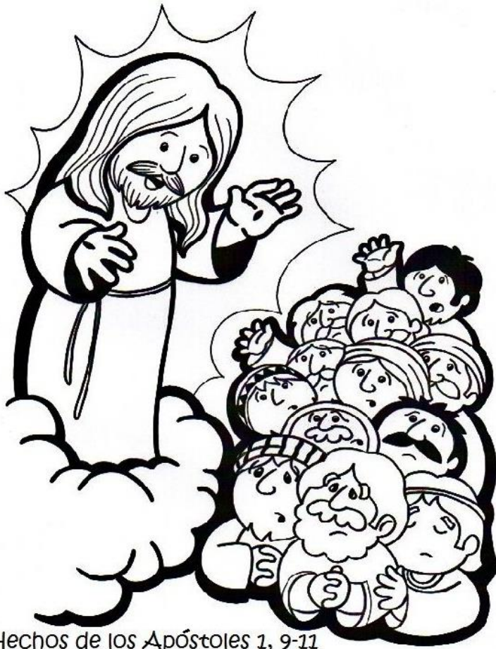
Hechos de los Apóstoles 1, 9-11

VAYAN Y HAGAN DISCÍPULOS EN TODAS LAS NACIONES, Y BAUTÍCENLOS EN EL N _____ DEL P _____, Y DEL H _____, Y DEL E _____ S _____.